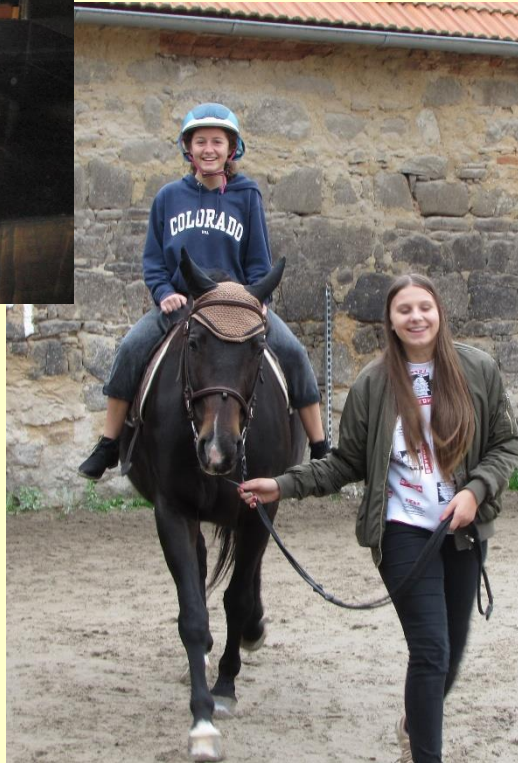
Jezdecká stáj Radčice