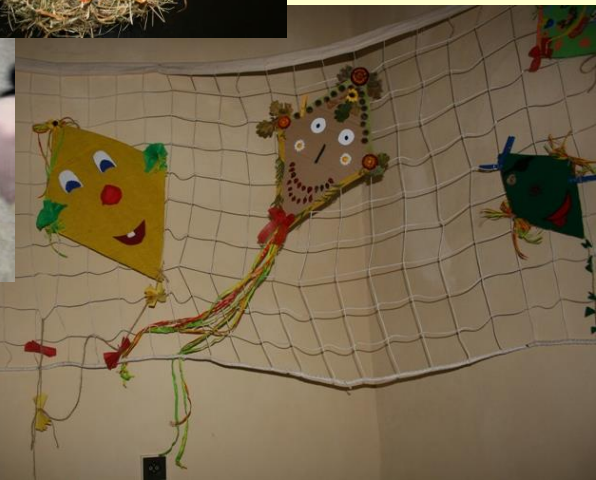
Hodiny ve škole a některé výrobky...