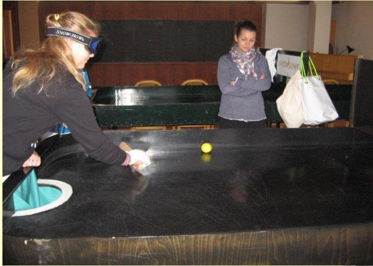
Speciálně pedagogické centrum pro děti se zrakovým postižením Plzeň