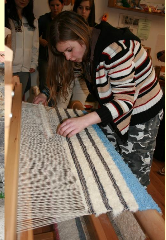
Oblastní Charita Rokycany