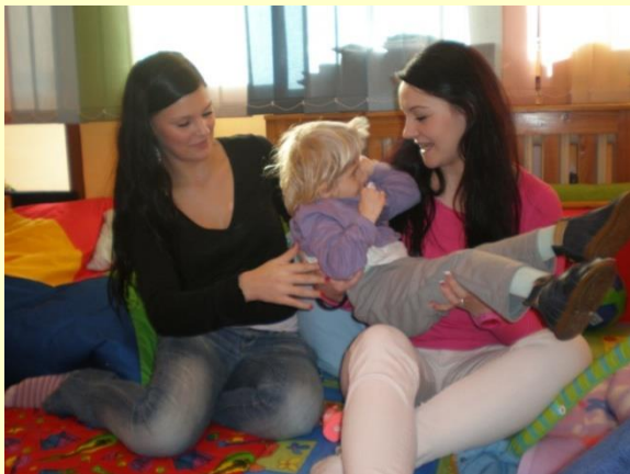
Denní stacionář Človíček, Plzeň